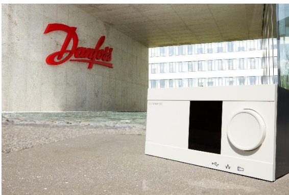
Bild 3: Danfoss ECL Comfort 310 Regler zur witterungsgeführten Vorlauftemperaturregelung in Fernwärme-, Zentralheizungs- und Fernkältesystemen. ©Danfoss