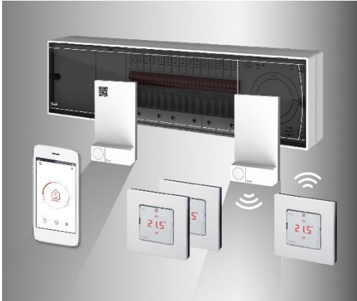
Bild 1: Smart Heating im Wohnbau mit Danfoss Icon Raumthermostaten für Fußbodenheizung.