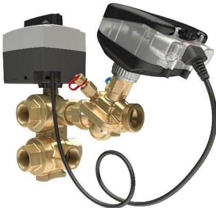
Bild 2: Digitaler Stellantrieb Danfoss NovoCon für dynamischen hydraulischen Abgleich in Zweckbauten wie zum Beispiel Bürogebäuden, Hotels oder Krankenhäusern.